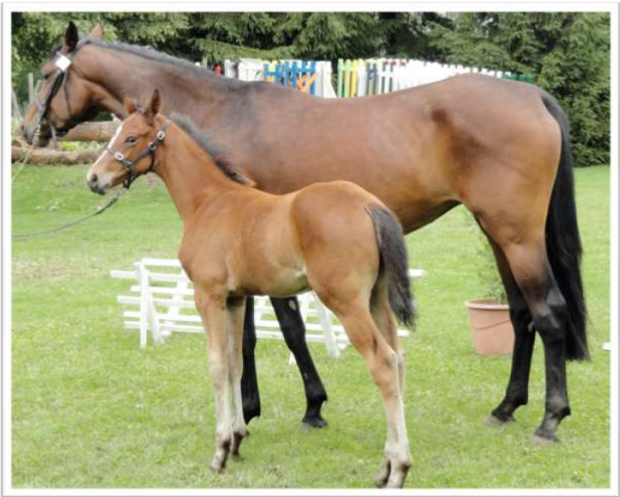
Concours de Sélection Poulinières / Foals

La région Picardie - Nord - Pas de Calais se classe d'ailleurs dans le trio de tête quant au montant global de la PACE (Prime d'Aptitude à la Compétition Equestre, servie aux juments en fonction des indices de réussite obtenus par elle-même ou leur production).