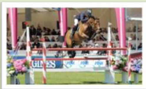
Odie de Frévent, Champion du Monde à Londres en 2012