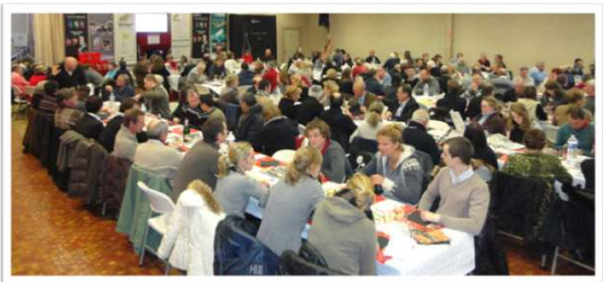
Assemblée Générale - janvier 2013

Elle réunit une fois par an, la deuxième semaine de janvier, les adhérents et le comité de l' AECCP , afin d'établir le bilan de la saison écoulée et d'envisager les évolutions à venir, veillant à rester à l'écoute des socioprofessionnels.