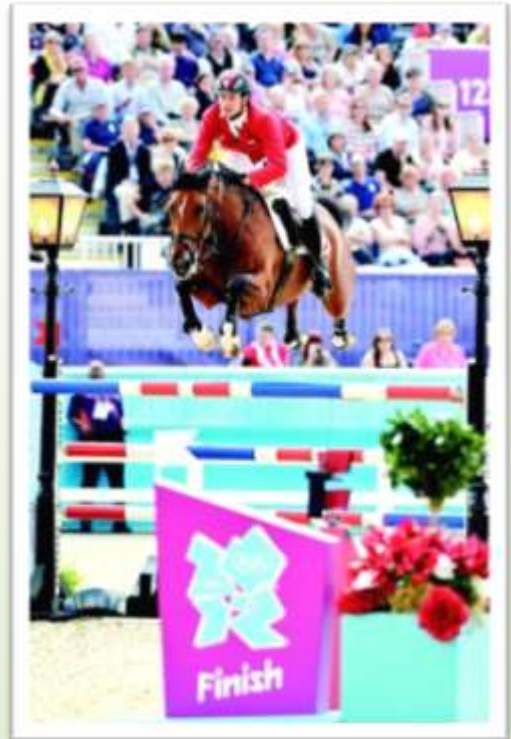
Nino des Buissonnets, Champion Olympique 2012